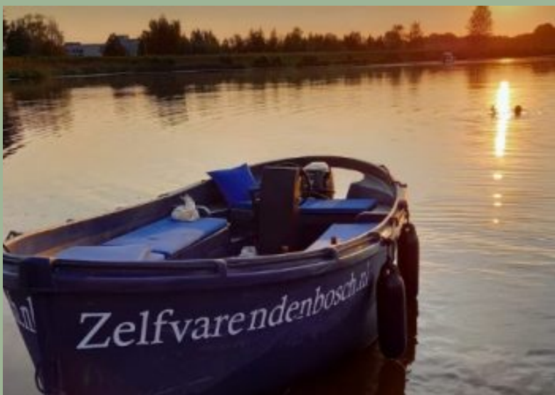
Sloep huren bij Zelf Varen

Den Bosch wordt ook wel eens 'Amsterdam van het Zuiden' genoemd doordat het net als de hoofdstad van Nederland rijk is aan grachtjes, bruggetjes en oude scheve huisjes. In deze waterrijke omgeving kun je genieten van een rondvaart op de Binnendieze. Maar nog leuker, je kunt ook zelf een bootje huren om het water op te gaan. Ik zou je aanraden om dit te doen bij 'Zelf varen Den Bosch'. Bij deze verhuurder kun je van maart t/m oktober sloepjes huren zonder dat je een vaarbewijs hoeft te hebben. Je kunt een sloep huren met een groep tot zeven personen.