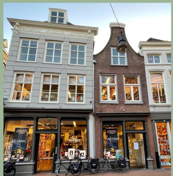
Boekhandel ADR. Heijnen